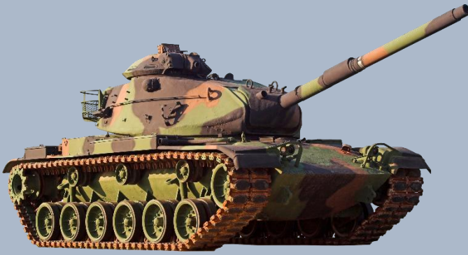
танк и трактор